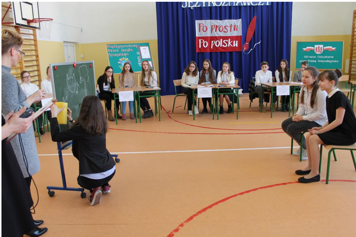
SP 4 w Olecku