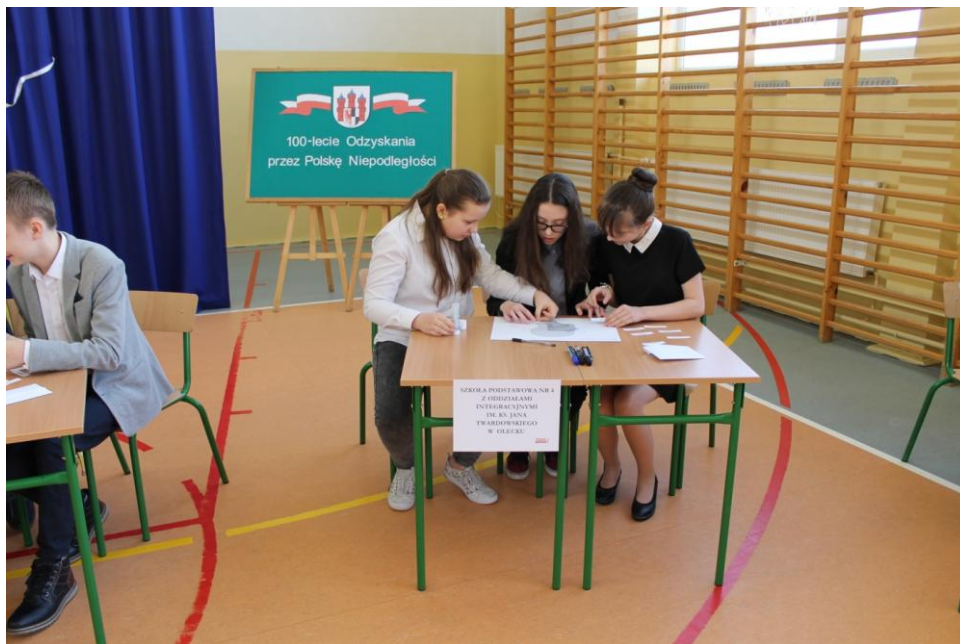
SP 4 w Olecku