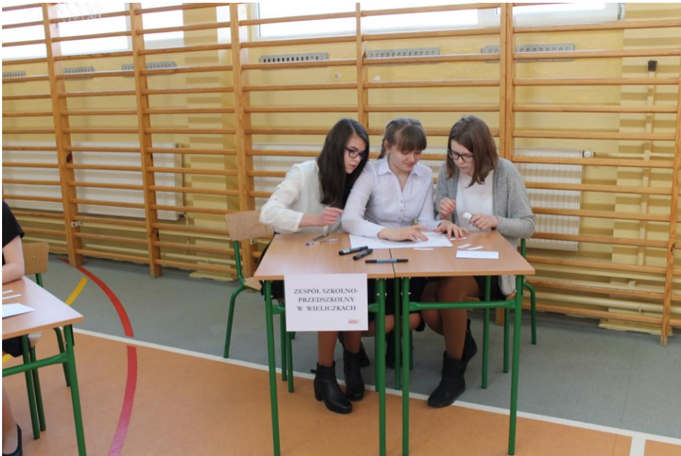
Zespół Szkolno-Przedszkolny w Wieliczkach