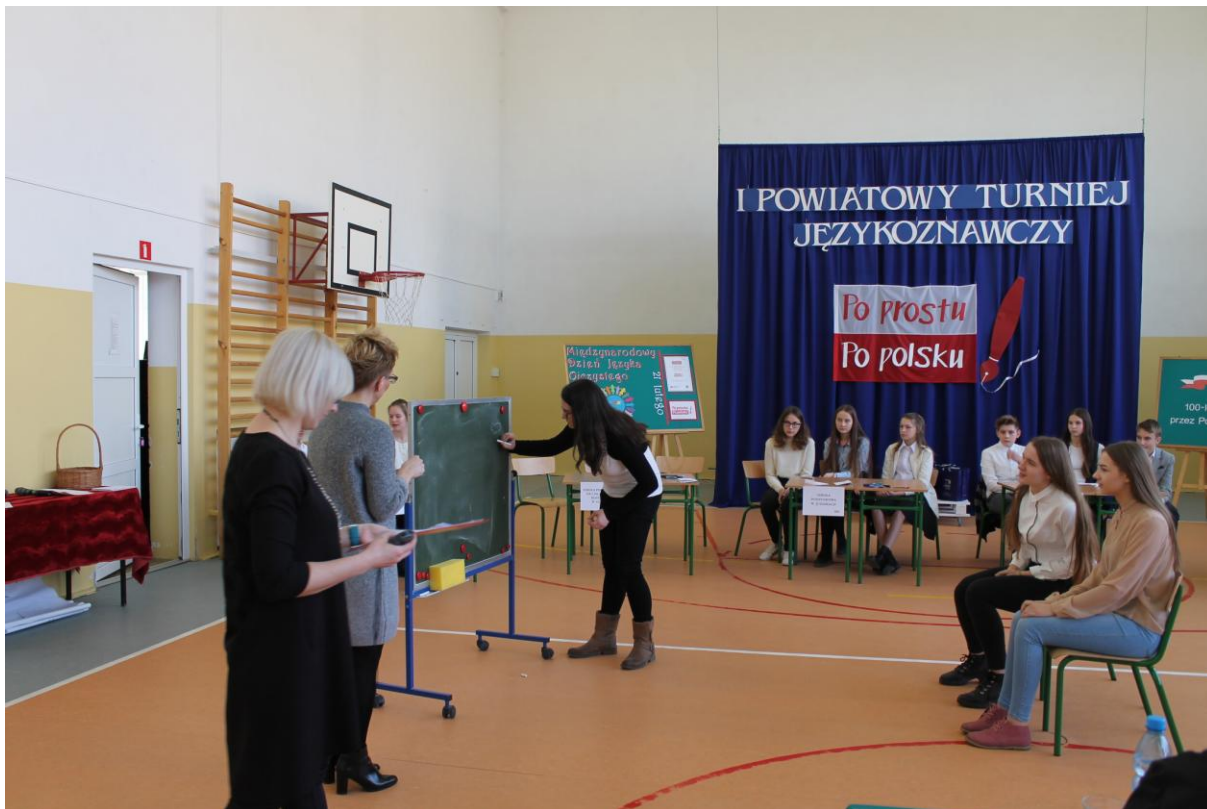
SP 2 w Olecku