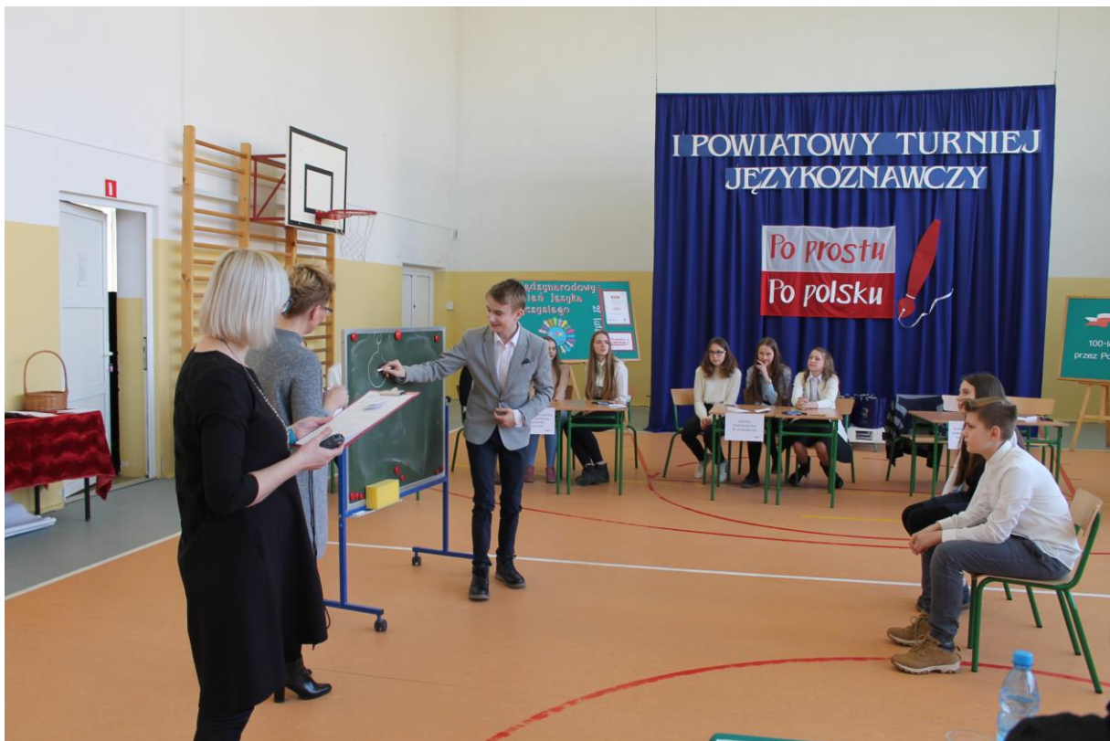
SP w Gąsках