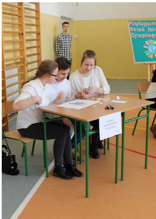
SP w Kijewie