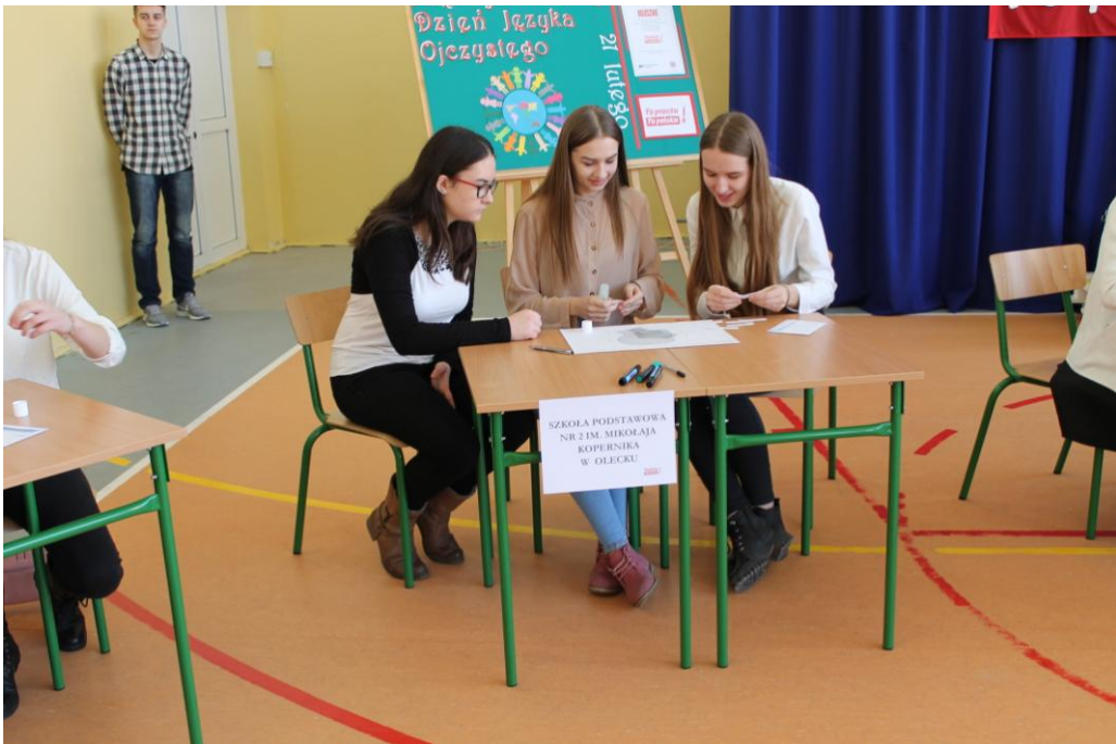
SP 2 w Olecku