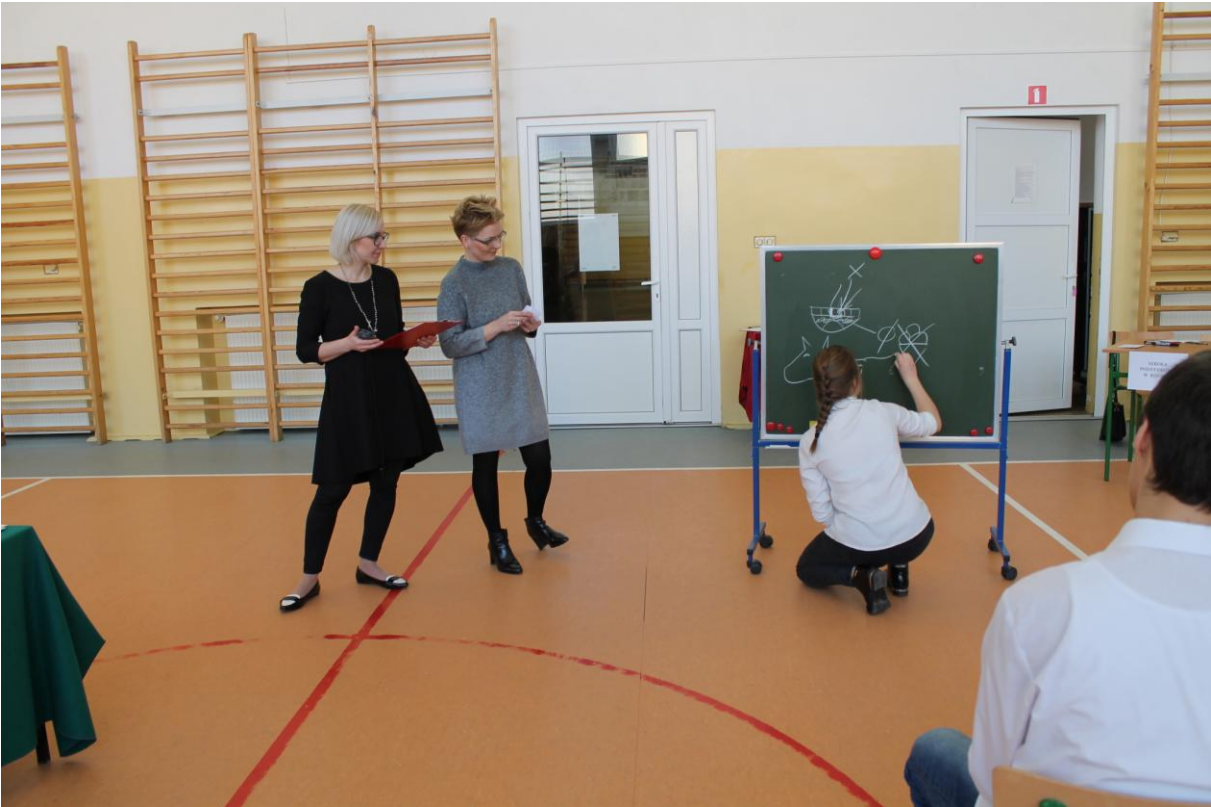
SP w Kijewie