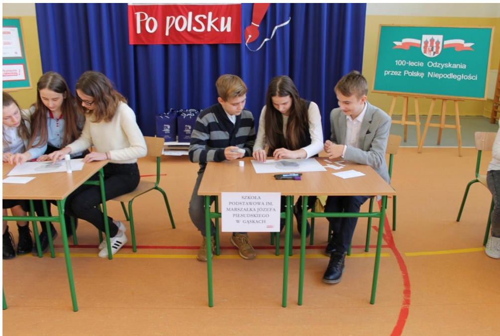
SP w Gąskach