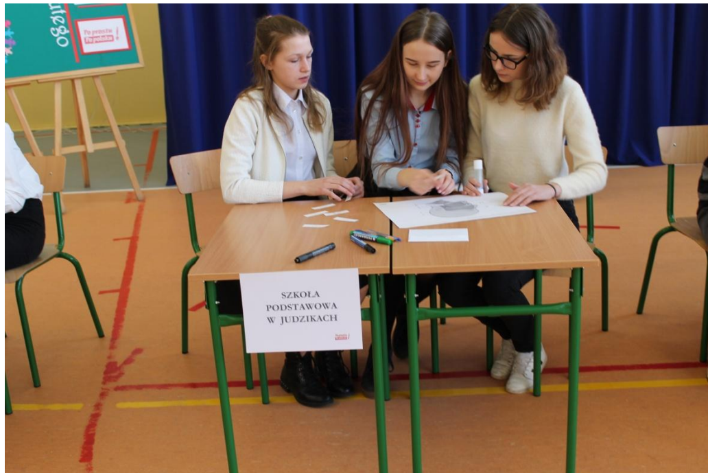
SP w Judzikach