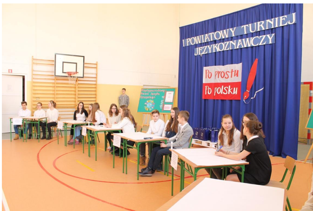
Przedstawiciele 3-osobowych zespołów