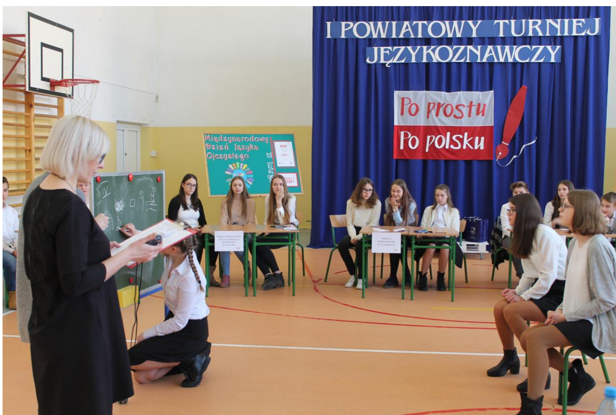
Zespół Szkolno-Przedszkolny w Wieliczkach