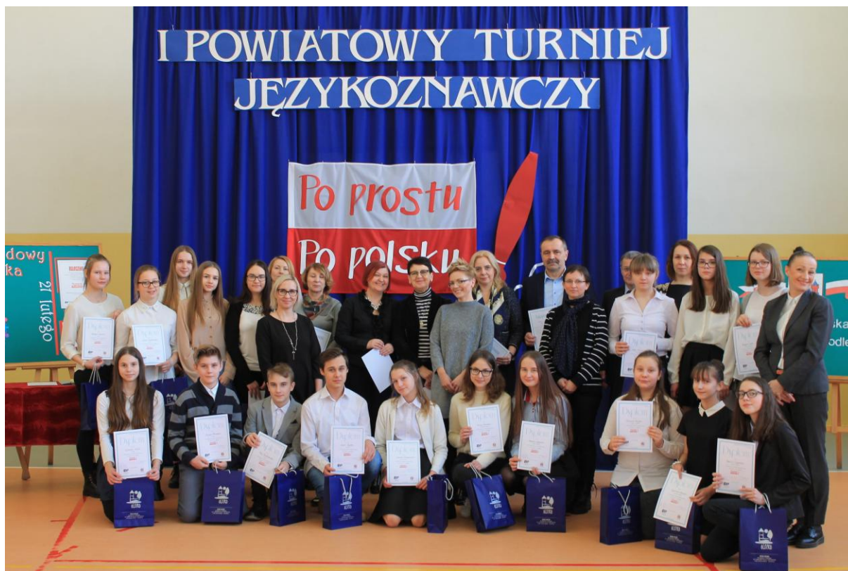
Nagrodzeni uczestnicy turnieju

Dzięki sponsorom, którymi byli lokalni przedsiębiorcy z powiatu oleckiego, żaden uczestnik turnieju nie wyszedł z pustymi rękoma. Za udział w turniejowych zmaganiach wszyscy otrzymali dyplomy, upominki książkowe, a zawodnicy zwycięskiej drużyny otrzymali nowoczesne e-booki renomowanej marki Kindle , za drugie miejsce uczestnicy otrzymali słuchawki, a za trzecie pojemne pendrive'y z możliwością podłączenia do telefonu komórkowego.